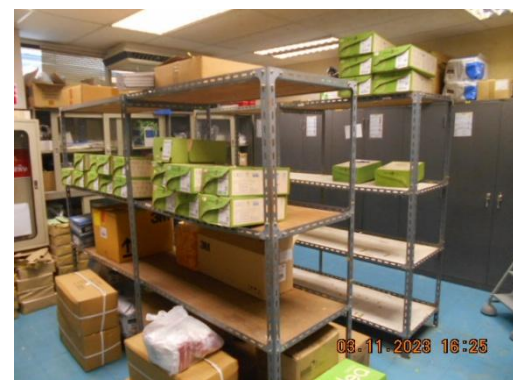
รูปที่ 34 อุปกรณ์คุ้มครองความปลอดภัยส่วนบุคคล

ภาพถ่ายประกอบผลการปฏิบัติตามมาตรการป้องกันและแก้ไขผลกระทบสิ่งแวดล้อม