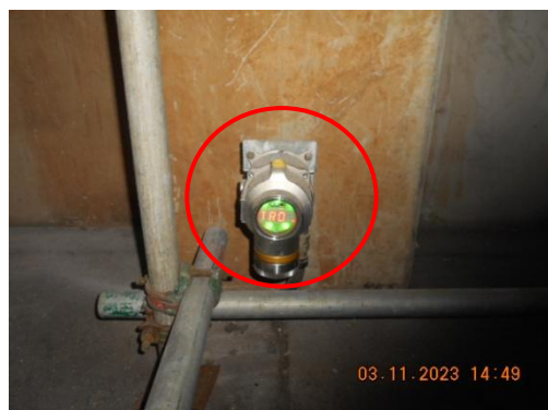
รูปที่ 27 Flammable Gas Detector