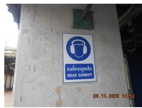
รูปที่ 10 ป้ายเตือนให้สวมใส่อุปกรณ์ป้องกันเสียง