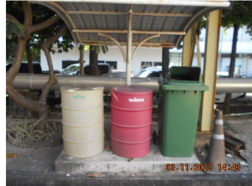
รูปที่ 14 ถังขยะแยกประเภทที่มีฝาปิดมิดชิด