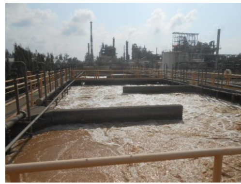
รูปที่ 8 ระบบบำบัดน้ำเสียของ โรงงานผลิตสารคาโปรแลคตาม