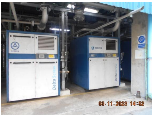
รูปที่ 9 อุปกรณ์ลดระดับเสียงที่แหล่งกำเนิด