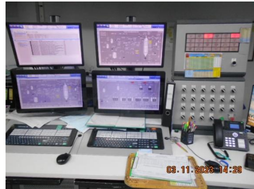
รูปที่ 36 ระบบควบคุมอัตโนมัติ