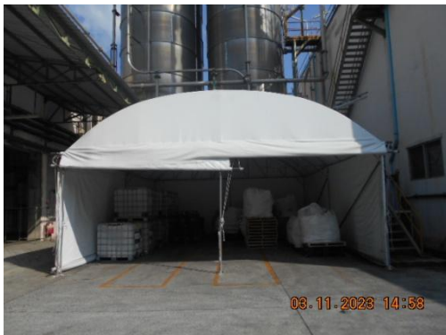
รูปที่ 15 อาคารเก็บกากของเสียรอการจัด