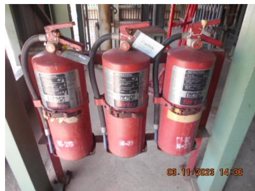
รูปที่ 26 ถังดับเพลิง