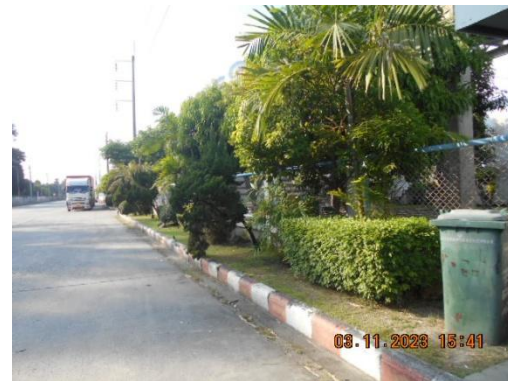
รูปที่ 38 พื้นที่สีเขียวภายในโรงงาน (ต่อ)