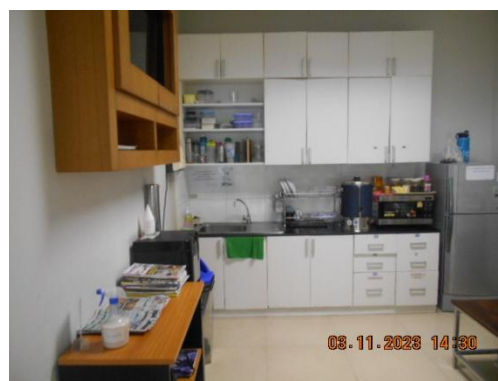
รูปที่ 12 ห้องพักพนักงาน

ภาพถ่ายประกอบผลการปฏิบัติตามมาตรการป้องกันและแก้ไขผลกระทบสิ่งแวดล้อม