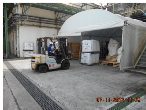
รูปที่ 17 พนักงานควบคุมและดูแลการจัดเก็บและเคลื่อนย้ายของเสีย

ภาพถ่ายประกอบผลการปฏิบัติตามมาตรการป้องกันและแก้ไขผลกระทบสิ่งแวดล้อม