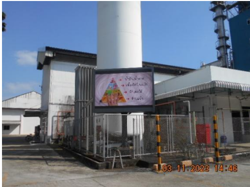
รูปที่ 35 ช่องทางการสื่อสารด้านความปลอดภัย