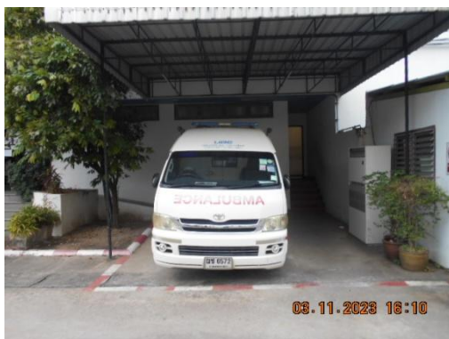
รูปที่ 31 รถพยาบาล