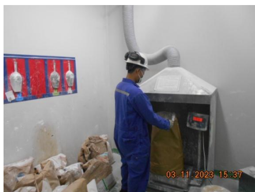
รูปที่ 33 พนักงานสวมใส่อุปกรณ์คุ้มครองความปลอดภัยส่วนบุคคลขณะเติมสารเคมี