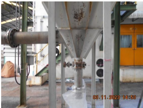
รูปที่ 3 Bag Filter ในระบบดำนึ่งเม็ดในลอน