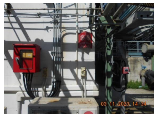
รูปที่ 28 Manual Call Point

ภาพถ่ายประกอบผลการปฏิบัติตามมาตรการป้องกันและแก้ไขผลกระทบสิ่งแวดล้อม