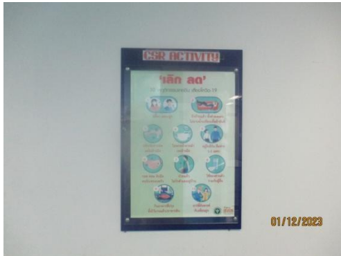
รูปที่ 13 บอร์ดประชาสัมพันธ์ และช่องทางการสื่อสารด้านความปลอดภัย