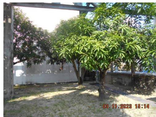
รูปที่ 38 พื้นที่สีเขียวภายในโรงงาน

ภาพถ่ายประกอบผลการปฏิบัติตามมาตรการป้องกันและแก้ไขผลกระทบสิ่งแวดล้อม