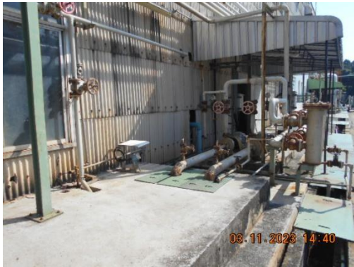
รูปที่ 7 บ่อตรวจสอบคุณภาพน้ำเสียของโรงงาน