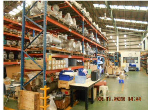
รูปที่ 2 ะโหล่งสำรอง อุปกรณ์ซ่อมบำรุง สำหรับบำบัดมลพิษทางอากาศ