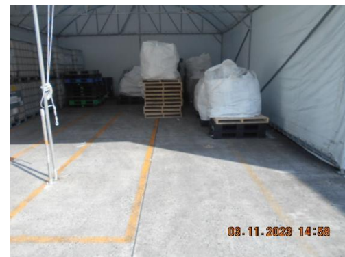
รูปที่ 16 การแบ่งพื้นที่ระหว่างมูลฝอยและสิ่งปฏิกูลหรือวัสดุที่ไม่ใช่แล้ว