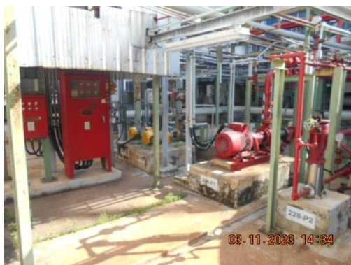
รูปที่ 25 ระบบท่อส่งน้ำดับเพลิง