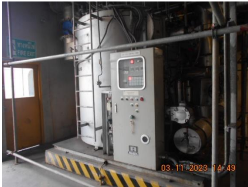
รูปที่ 1 Hot Oil Heater