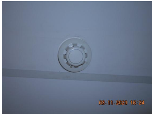
รูปที่ 29 Smoke Detector