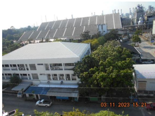
รูปที่ 39 รูปแบบอาคารสิ่งก่อสร้าง ที่ไม่ทำลายทัศนียภาพและสิ่งแวดล้อม