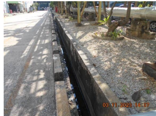
รูปที่ 4 รางระบายน้ำฝน