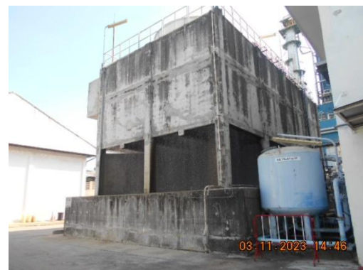
รูปที่ 6 Cooling Tower

ภาพถ่ายประกอบผลการปฏิบัติตามมาตรการป้องกันและแก้ไขผลกระทบสิ่งแวดล้อม