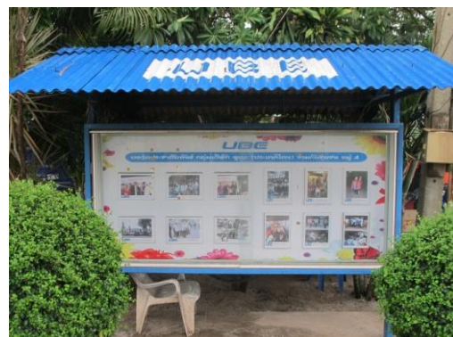
รูปที่ 40 บอร์ดแสดงผลการติดตามตรวจสอบ คุณภาพสิ่งแวดล้อม

ภาพถ่ายประกอบผลการปฏิบัติตามมาตรการป้องกันและแก้ไขผลกระทบสิ่งแวดล้อม