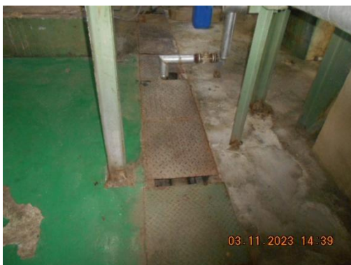
รูปที่ 5 รางระบายน้ำเสีย