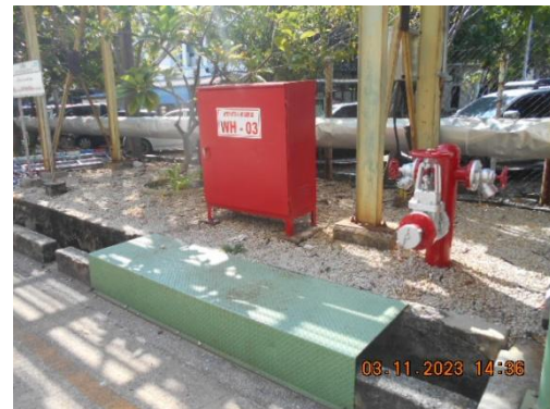
รูปที่ 24 Hose Box และหัวจ่ายน้ำดับเพลิง