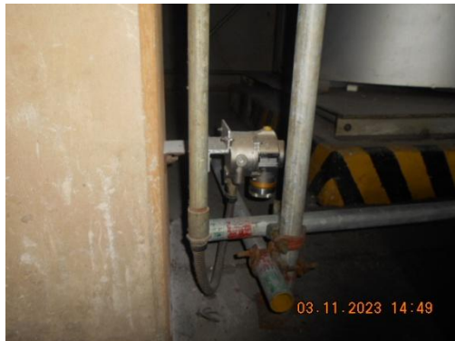
รูปที่ 23 Gas Detector