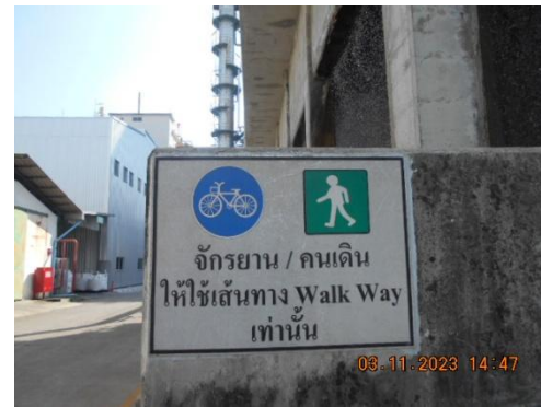
รูปที่ 18 ป้ายจราจรและป้ายจำกัดความเร็วภายในโรงงาน