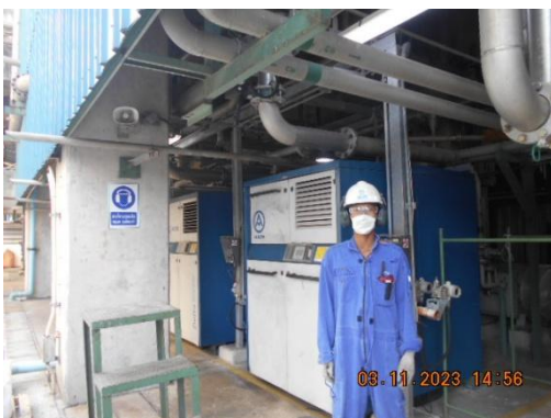
รูปที่ 11 พนักงานสวมใส่อุปกรณ์ป้องกันเสียง