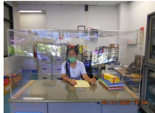
รูปที่ 30 พยาบาลประจำห้องพยาบาล